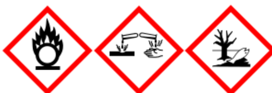
Figure 1. Pictogramme du nitrate d'argent.

Le Tableau 3 regroupe les codes de danger du nitrate d'argent.