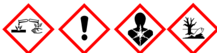
Tableau 3. Codes de danger du 4-tert-butylphénol, d'après ECHA.